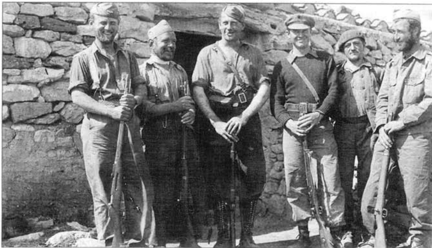
Un grupo de brigadistas, en una de las fotografías que aparecen en el libro. SOIS LEYENDA

El libro recoge numerosos testimonios que realizaron los brigadistas y con los que se pretende dejar reflejado también el aspecto más humano de los combatientes, "además de su compromiso ideológico con la causa de la libertad, que no sería secundado por los gobiernos occidentales". Salvador Trallero recordó una cita: "No culpo al pueblo inglés porque estén dormidos en momentos de peligro.