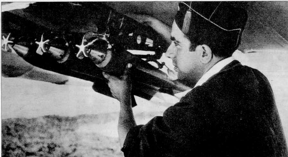
Colocando bombas en un avión

Poco después, a la altura de Huesca, el avión planeó y a seguido percibimos el estallido de unas bombas que habían caído en los cuarteles situados a la entrada de la ciudad. Una densa columna de humo hendió el espacio y ascendió en línea recta como si quisiera lanzar su cortina asfíxica alrededor del bravo aviador que imperturbable iba descargando toda su dotación de proyectiles.